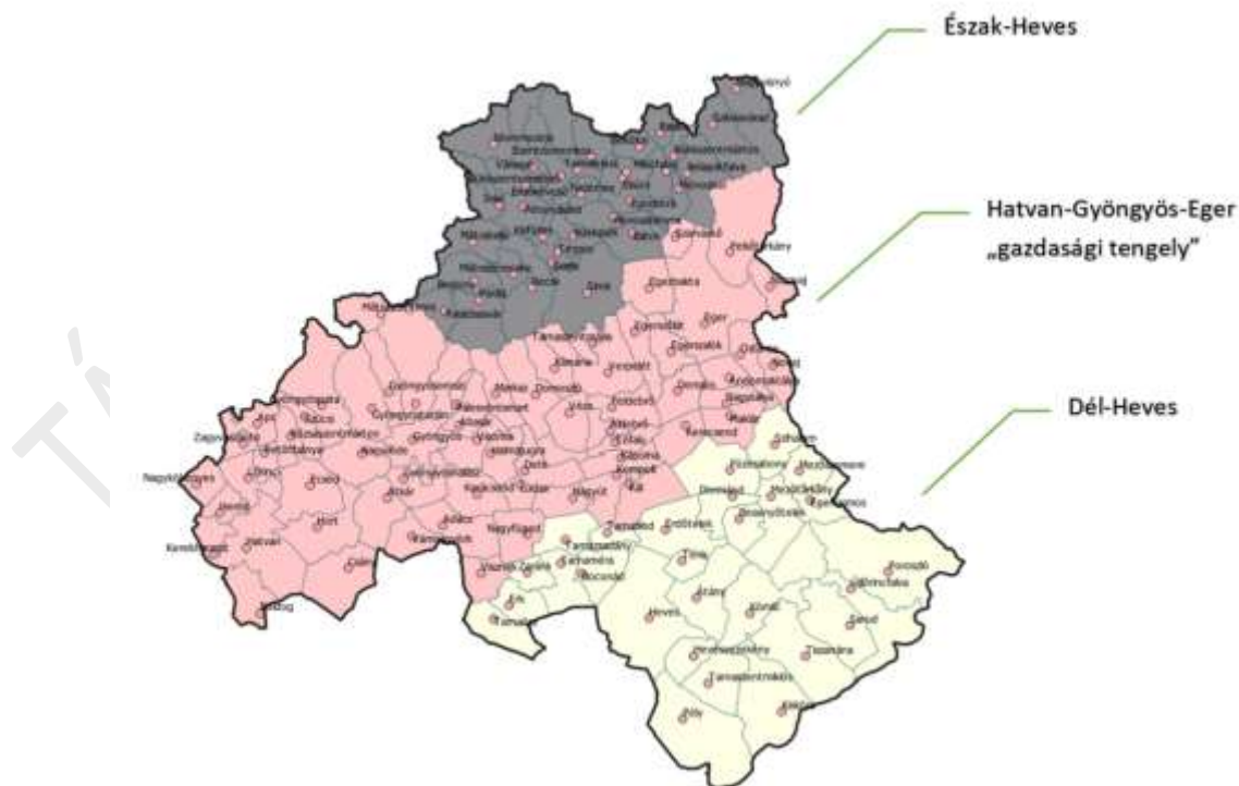
2. ábra Heves megyén belüli fejlesztési térségek

Annak érdekében, hogy a beavatkozások megyén belüli differenciálása, illetve a területi tervezési későbbi folyamatai alátámasztásra kerüljenek szükséges az egyes területegységek településszintű lehatárolása, mely a Konceptió adatait és térképi tartalmát elemezve az alábbiak szerint rajzolódik ki.